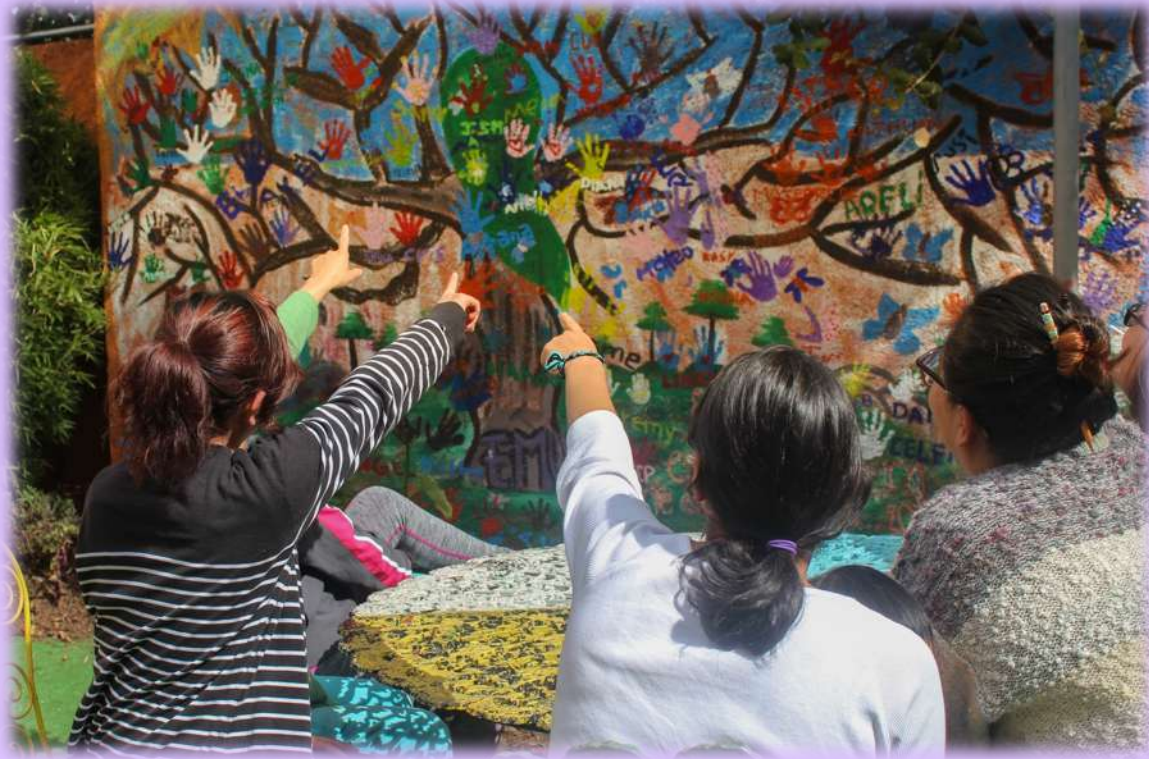
Mujeres frente a mural elaborado por toda la población que ha residido en el Refugio.